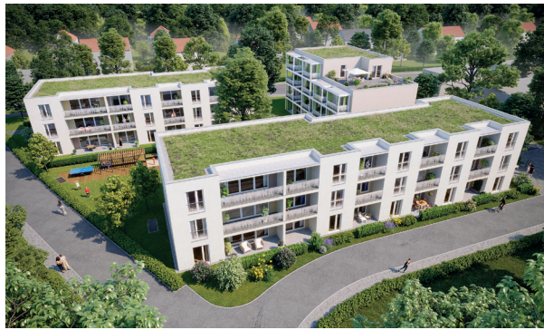
Visualisierung: ZG Architekten GmbH, Ulm

Geplanter Neubau am Fichtenweg in Laupheim